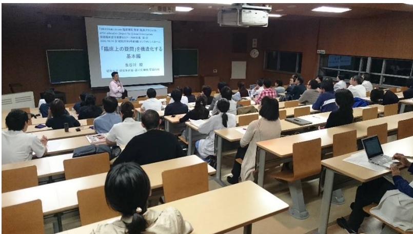
セミナー会場となる1号館7階教室（階段教室）