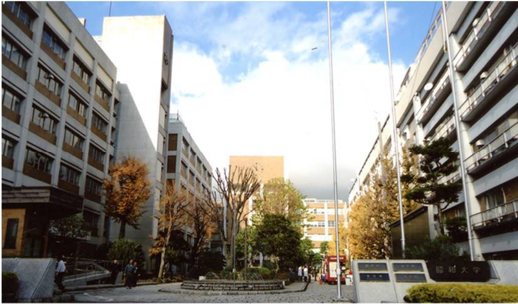
旗の台キャンパス正面（一番奥の大きな時計が目印の建物が1号館）